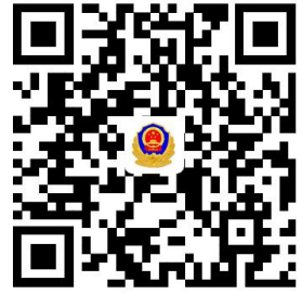
出入境权力事项清单