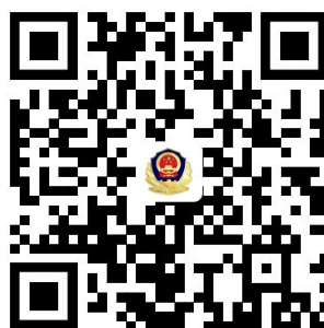
2.变更机动车驾驶证联系方式