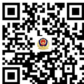
6. 补/换领机动车行驶证