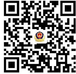
公安权力事项清单