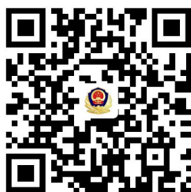
4. 机动车临时通行牌证核发